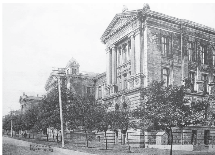
Медицинские лаборатории Медицинского факультета Новороссийского университета. Арх. Н. К. Толвинский