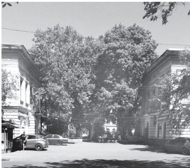
Клиника хирургии, акушерства и женских болезней Медицинского факультета Новороссийского университета. Арх. Н. К. Толвинский, А. И. Бернардацци