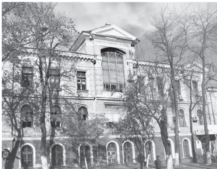
Клиника глазных болезней Медицинского факультета Новороссийского университета. Арх. А. И. Бернардацци

7 та Императорского Новороссийского университета, прошу Вас исходатайствовать надлежащим путем разрешение на принятие пожертвования моего капитала в размере семидесяти пяти тысяч рублей на постройку детской клиники медицинского факультета Новороссийского университета. Деньги обещаю внести, когда потребуется приступить к постройке клиники.