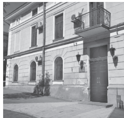
Здание ректората Одесского национального медицинского университета