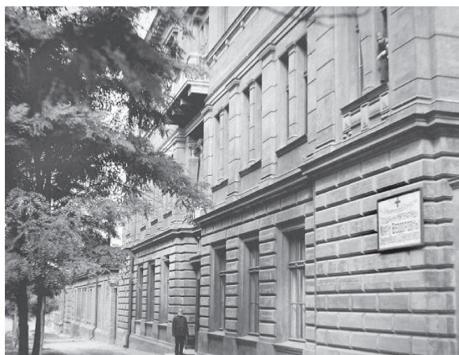
Здание Центральной амбулатории при клиниках медицинского факультета Императорского Новороссийского университета. Арх. Н. К. Толвинский, А. И. Бернардацци

Это было в конце XIX века, мы же возвращаемся к самой площади начала 80-х. Хлебные торжища перемещаются на Пересыпь, на площади тренируют солдат, а в 1881 году ее отдают в аренду Осе