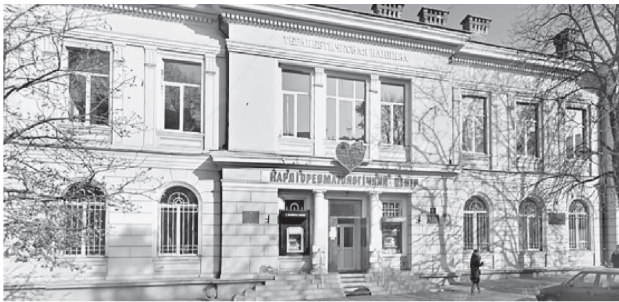
Терапевтическая клиника Медицинского факультета Новороссийского университета (Пастера, 9). Арх. А. И. Бернардацци

(литературный псевдоним М. Ф. Фрейденберга, дяди лауреата Нобелевской премии, писателя и поэта Бориса Пастернака), разработчику первой автоматической телефонной станции, и который на Безыменной площади запуская аэростаты.