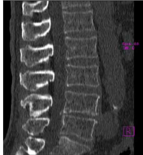
Рис. 1. a), b), c) – ЯМР (MRI) — диагностика; d) – МКТ – диагностика

В результате проведенного лечения у 92% процентов больных наступило улучшение состояния уже через 10 дней. Все больные данной группы отметили уменьшение боли в поясничном отделе, улучшение функции тазовых органов. Объективно было выявлено также снижение степени неврологических расстройств, нормализацию функция и тонус мышц.