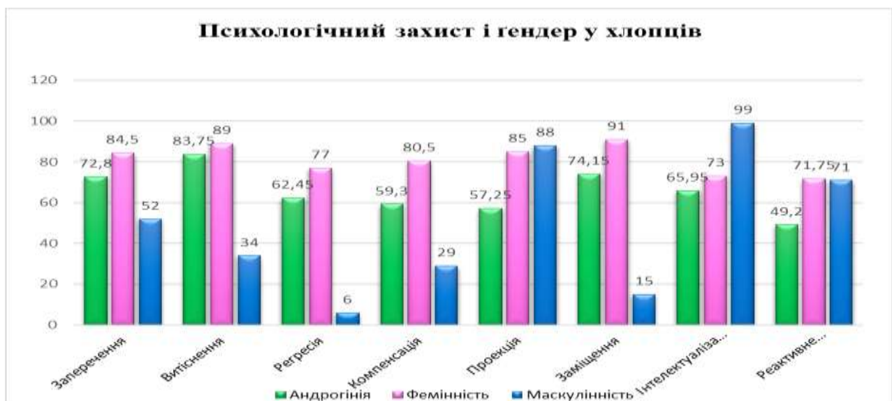
Рис. 3. Психологічних захист і гендер у хлопців

Але, у хлопців не спостерігається подібної тенденції, маскулінні механізми психологічного захисту мають незначну зворотну кореляцію і з власниками механізмів психологічного захисту, що типові для чоловіків і для жінок (коефіцієнт кореляції склав P < 0,2 ).