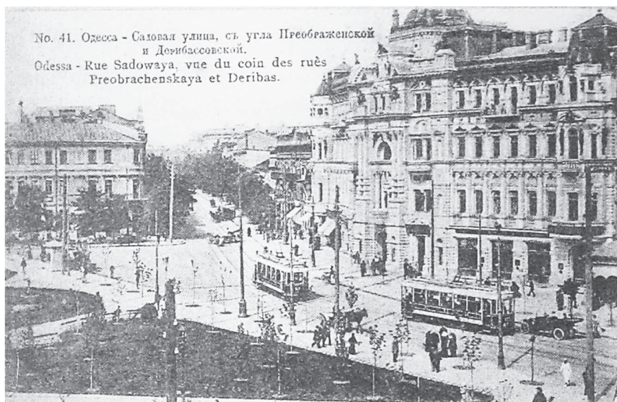
Фото ул. Садовой из книги: 100 великих одесситов

Среди химических соединений, представленных компанией «Байер», — всем известный аспирин ( Aspirin ). С 6 марта 1899 г. аспирин был внесен в реестр новых знаков Имперского патентного бюро под № 36433 как новый товарный знак и стал фактически официальной торговой маркой компании «Байер». Кстати, сначала открытие аспирина приписывалось Ф. Хоффману — штатному химику-исследователю «Байер», однако после 1949 г. экс-сотрудник компании Артур Эйхенгрин заявил, что именно он был изобретателем и руководителем первых клинических испытаний аспирина. Эйхенгрин как еврей во время Холокоста Второй мировой войны был разорен и