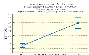
Рис. 4. Диаграмма факторного анализа, отражающая пороговый уровень ППОД — более 22,7 см 2 , по достижении которого достоверно увеличивается частота рецидивов при аллопластике.