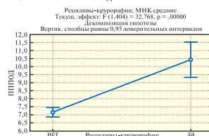
Рис. 3. Диаграмма факторного анализа, отражающая пороговый уровень ППОД — более 9,4 см 2 , по достижении которого достоверно увеличивается частота рецидивов при круорографии.