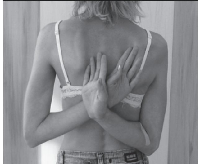
Рисунок 5. Внутренняя ротация