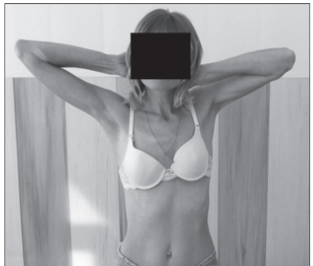
Рисунок 6. Наружная ротация