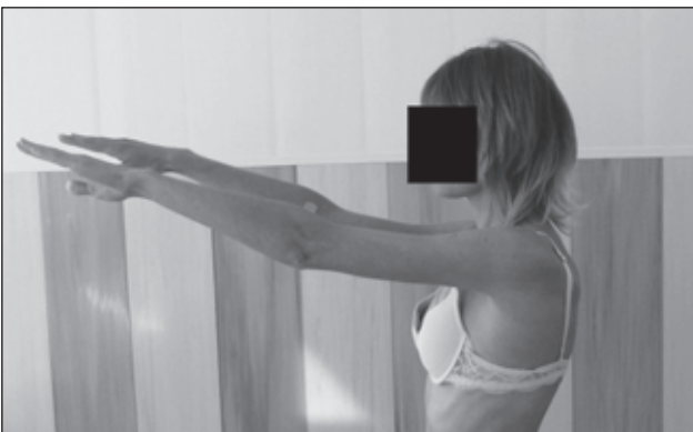
Рисунок 4. Сгибание