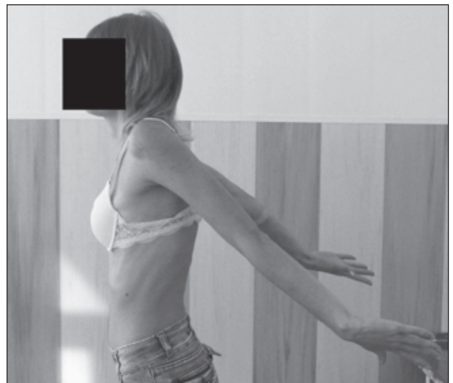
Рисунок 7. Разгибание