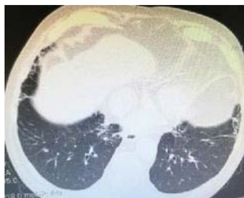
Рис. 2. Картина булезной эмфиземы, пневмофиброза (после оперативного лечения)