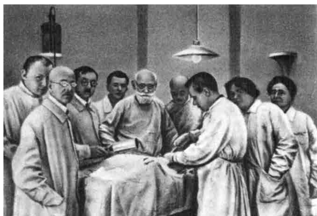
И. П. Павлов на операции в Институте экспериментальной медицины.

Нигде более так сильно не прослеживается безграничная вера И. П. Павлова в науку, как в его предисловии к его избранным лекциям и статьям «20 лет объективного изучения высшей нервной деятельности у животных». Рассуждая о своих сомнениях относительно возможности научного исследования функций коры головного мозга при помощи преимущественно физиологических методов изучения, а не психологических, И. П. Павлов пишет: «Постепенно, по мере успехов наших исследований, эти сомнения появляются реже, и сейчас я убежден в том, что, занимаясь этими исследованиями (имеются в виду условные рефлексы), мы достигнем конечного общего успеха в изучении... механизмов и законов человеческой жизни. Только таким образом можно достичь полного и правдивого успеха. ...Только