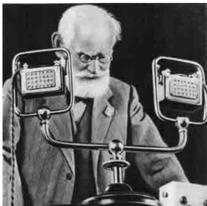
Председатель XV Международного конгресса физиологов — И. П. Павлов на тирбуне конгресса.

«И. П. Павлов верил в то, что большевистская революция — величайшая неудача, которая постигла Россию. Он, не таясь, говорил это как в личных беседах, так и во время студенческих лекций. ... Однажды