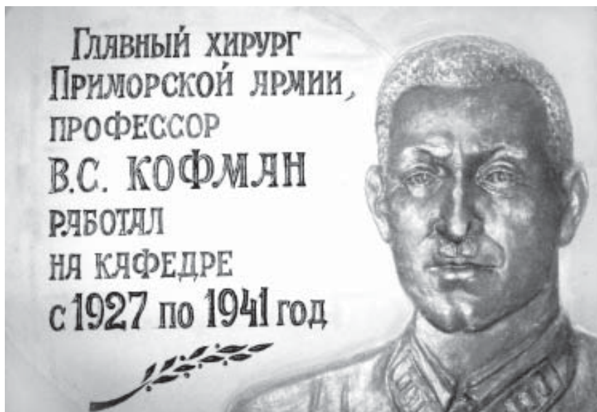
Мемориальная доска в память о В. С. Кофмане