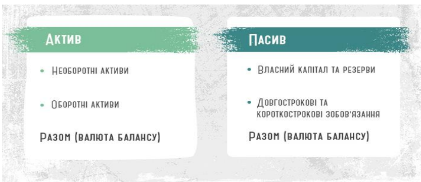
Рис. 2.2. Структура балансу за Міжнародними стандартами фінансової звітності