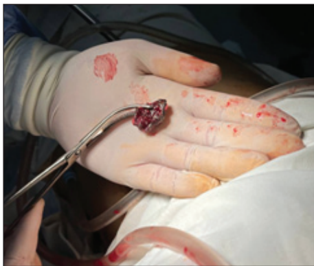
Рис. 3. Видалене стороннє тіло (металевий осколок)

Операції: торакоцентез, дренажування правої плевральної порожнини за Бюлау; ПХО вогнепальної рани.