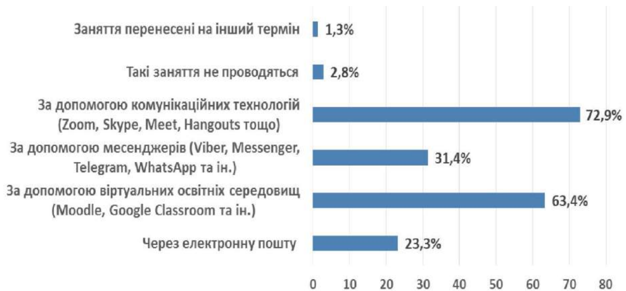
Рис. 3. Аналіз використання прогресивних інструментів дистанційного навчання.

До освітніх технологій, найбільш пристосованих для використання в дистанційному навчанні, відносяться: відео-лекції; мультимедіа-лекції та практичні завдання; електронні інтерактивні підручники; комп'ютерні тести та експертні системи; програми для моделювання процесів та ситуацій, інтерактивні тренажери; онлайн-консультації та відеоконференції. Саме відеоконференції останнім часом набирають все більшої популярності. У багатьох програм, які можуть бути встановлені як на комп'ютер, так і на телефон, можна виділити програми, що надають безкоштовні послуги зв'язку. Звичайно, безкоштовні тарифи цих програм, як правило, мають низку обмежень, таких як тривалість зв'язку та кількість учасників конференції. Зазвичай це число не перевищує 4-6 учасників, але окремі компанії пропонують програми з безкоштовним доступом до ста учасників одночасно, та безліччю додаткових платних функцій, що створюють зручність і комфорт при роботі [3].