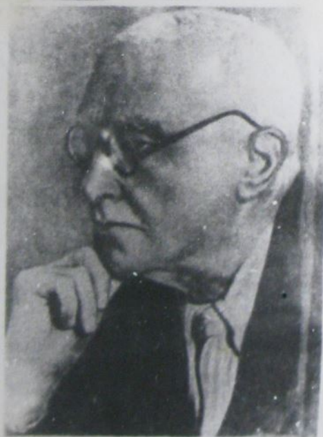
ГАМАЛЕЯ НИКОЛАЙ ФЕДОРОВИЧ