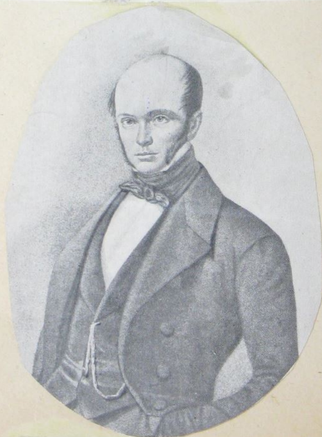
Н.И.Пирогов— —почётный член "Общества Одесских врачей".