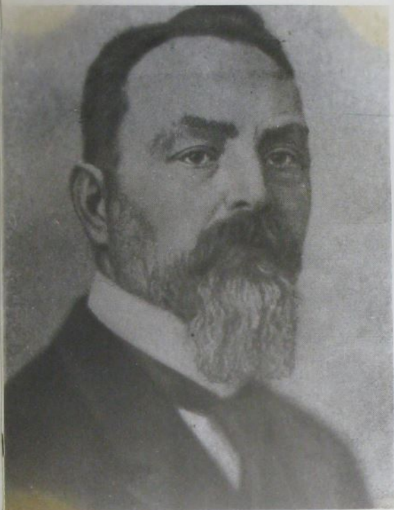
ЯКОВ ВЛАДИМИРОВИЧ ЗИЛЬБЕРБЕРГ (1857—1934)