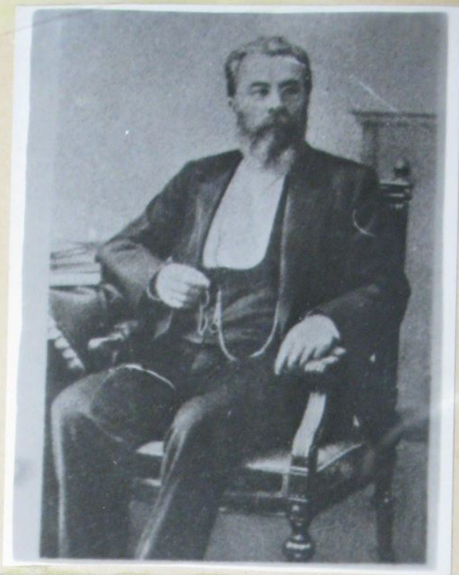
Н.В.Склифосовский— —первый Президент "Общества Одесских врачей".

В 1849 году в Одессе было организовано "Общество Одесских врачей" под девизом: "Vires unitas agunt" (в единении сила).