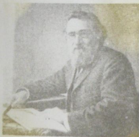
И. И. МЕЧНИКОВ