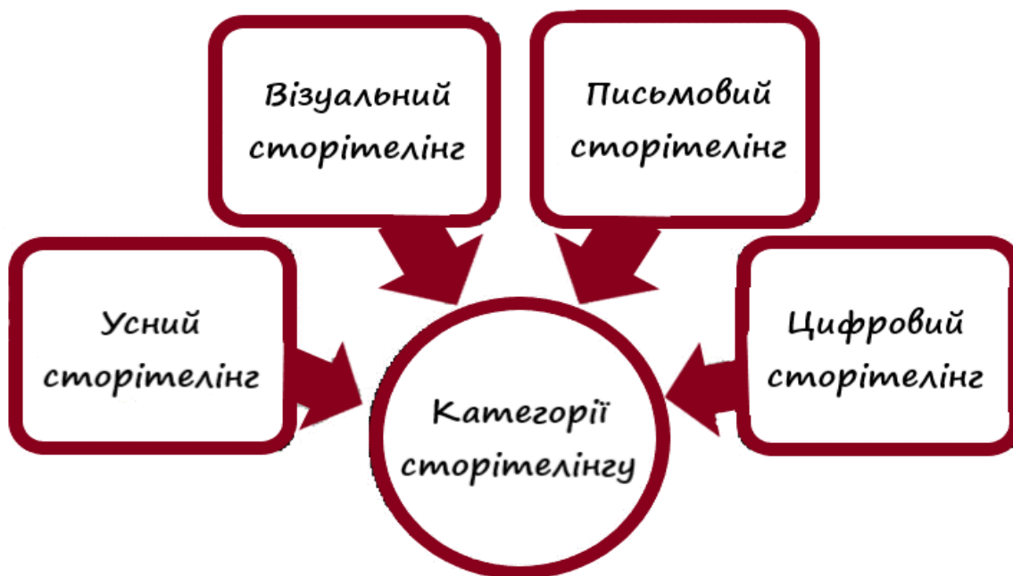
Рис. 1. Типи сторітелінгу