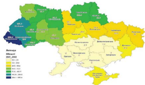
Рис. 4. Розподіл прогнозних водних ресурсів місцевого стоку у 2041–2060 рр. по адміністративних областях України

У 2041–2060 рр. – період середньої водності – вона охоплюватиме території Херсонської, Одеської, Миколаївської та Запорізької областей, а в 2061–2080 рр. до неї приєднуються Дніпропетровська, Запорізька, Кіровоградська області та АР Крим (рис. 4).