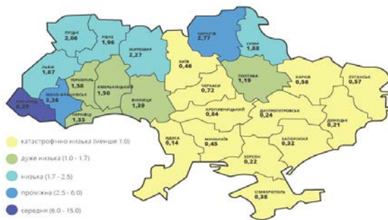
Рис. 3. Забезпеченість регіонів України місцевими водними ресурсами, тис. м 3 /рік на одну людину

Згідно з міжнародною класифікацією більше половини території України характеризується катастрофічно низьким місцевим стоком. Особливо це стосується Півдня країни (Одеська, Миколаївська, Херсонська, Запорізька області). Це 0,14, 0,45, 0,22, 0,32 тис. м 3 на одну особу відповідно (рис. 3).