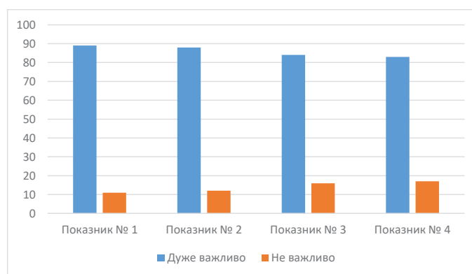
Рис. 1. Результати опитування реципієнтів на тему «Структура комунікативної складової іміджу лікаря» (Показники №1–4)