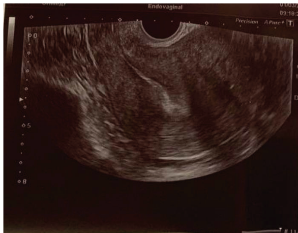
Рис. 1б. УЗД пацієнтки з діагнозом: аденоміоз 2–3 ст., міома матки субсерозний варіант, гіперплазія ендометрію